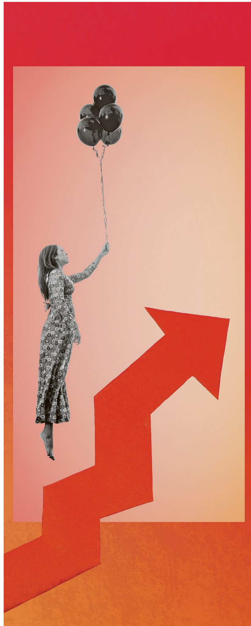
Illustration: Susse Heinz

Weibel Hess & Partner AG hat im Auftrag der Sonntagszeitung und der «Finanz und Wirtschaft» die Anbieter im 1e-Markt verglichen. Sie wurden mit einer verdeckten Ausschreibung für eine Unternehmung mit sechs Kadermitarbeitenden angeschrieben. Das Mystery Shopping zeigt die grossen Differenzen bei den Risiko- und Verwaltungskosten sowie den Stiftungsgebüh-