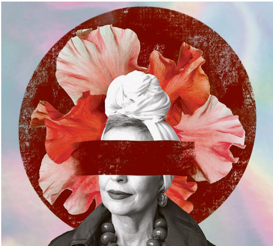
Illustration: Suse Heinz

Dies zeigt, dass eine Querfinanzierung nur möglich ist, wenn im Zeitpunkt der Pensionierung ausreichend überobligatorisches Guthaben vorhanden ist. Für angehende Pensionäre, die lediglich obligatorisches Sparkapital haben, muss die Rente nach den geltenden Mindestvorgaben berechnet und gegebenenfalls durch die Vollversicherung aufgestockt werden.