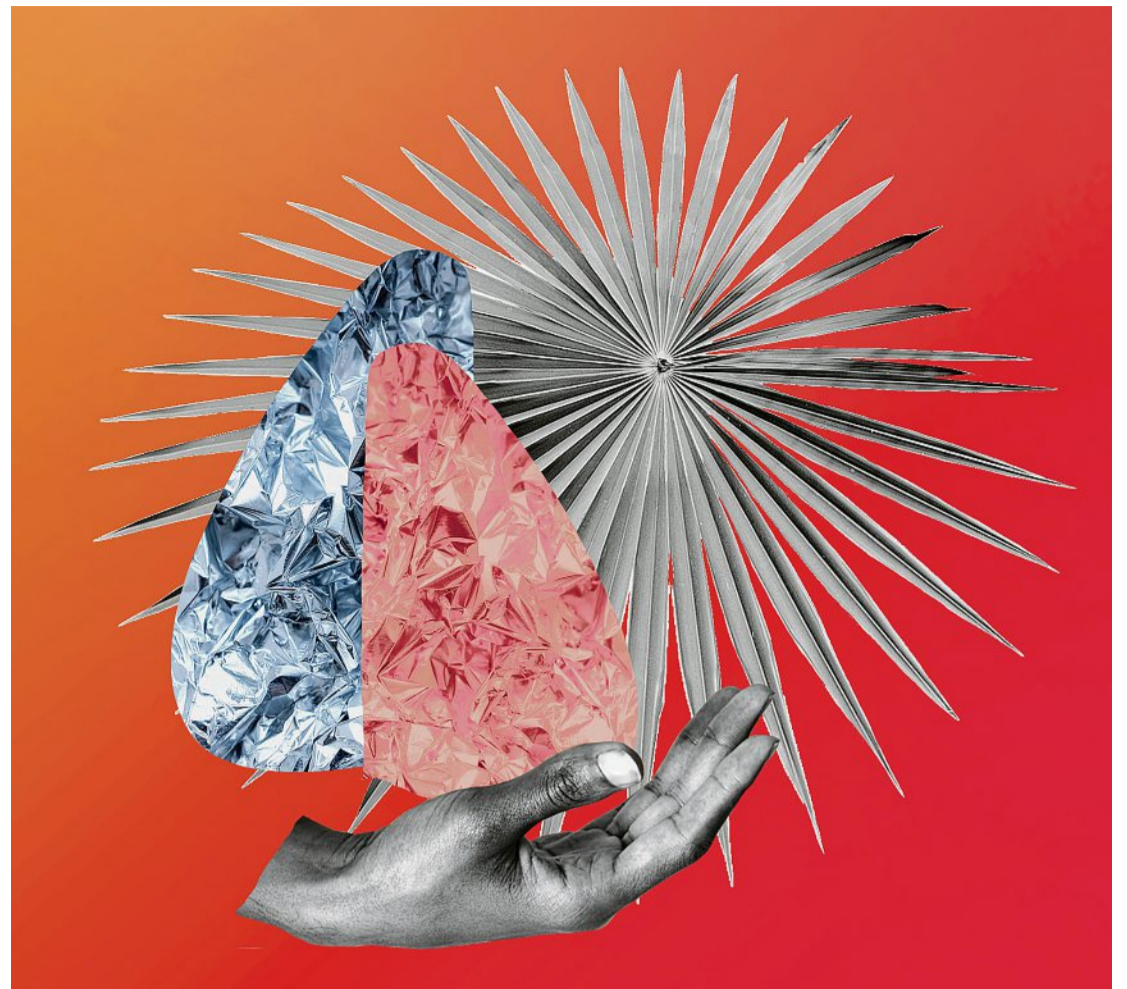
Illustration: Suse Heinz

Dieses grosse Ungleichgewicht zwischen Kosten und Leistungen in der Vollversicherung hat dazu geführt, dass die Sammel- und Ge-