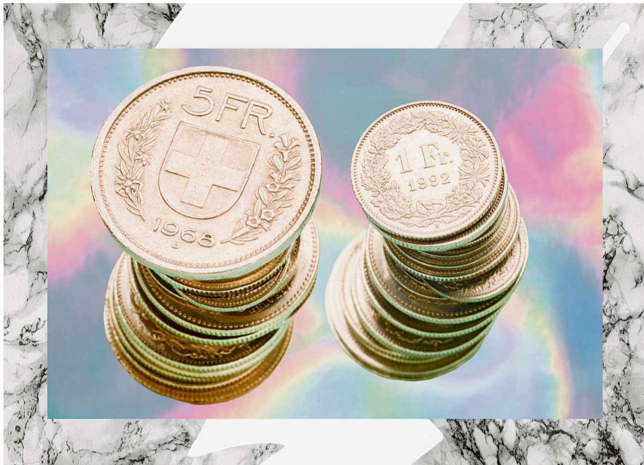
Illustration: Susie Heinz

Firmen sind gut beraten, ihre Pensionskassenlösung regelmässig zu überprüfen. In den vergangenen Jahren haben viele Pensionskassen ihre Risikoprämien gesenkt. Treue, langjährige Kunden haben jedoch oft das Nachsehen. Ohne Eigeninitiative profitieren sie nicht von kostengünstigen Risikoprämien. Bestehende Anschlussverträge werden mit unveränderten Konditionen über Jahre weitergeführt. Wollen Firmen nicht zu den Verlierern gehören, ist eine regelmässige Prüfung und die Aushandlung neuer Konditionen ein Muss. Weitere Aspekte wie Sicherheit, Anlagestruktur und Altersleistungen sind bei der Prüfung selbstverständlich miteinzubeziehen.